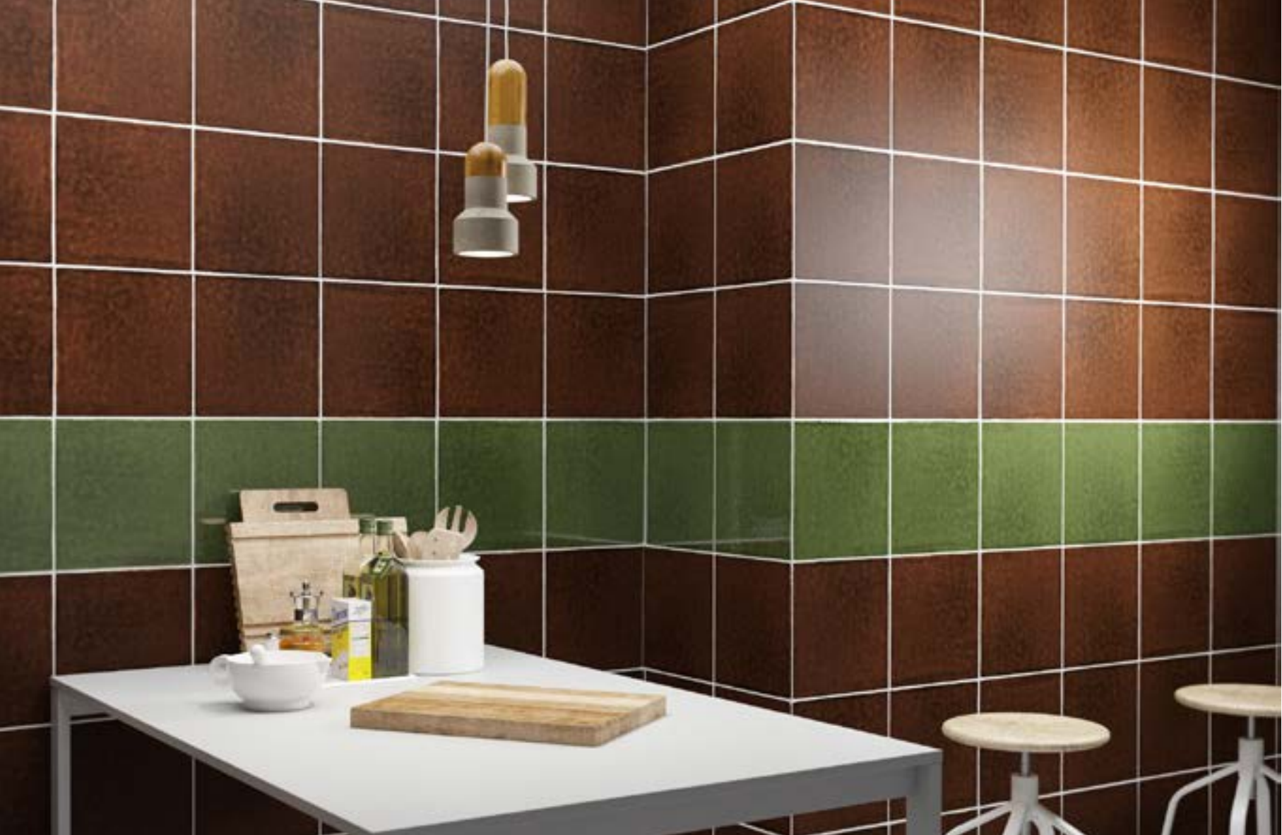
Sensazioni lucido , colore olivella_formato 20x20 Sensazioni opaco , colore Toupe_formato 20x20 _in pasta cotto vietrese