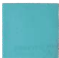
Acqua di mare