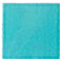
Acqua di mare