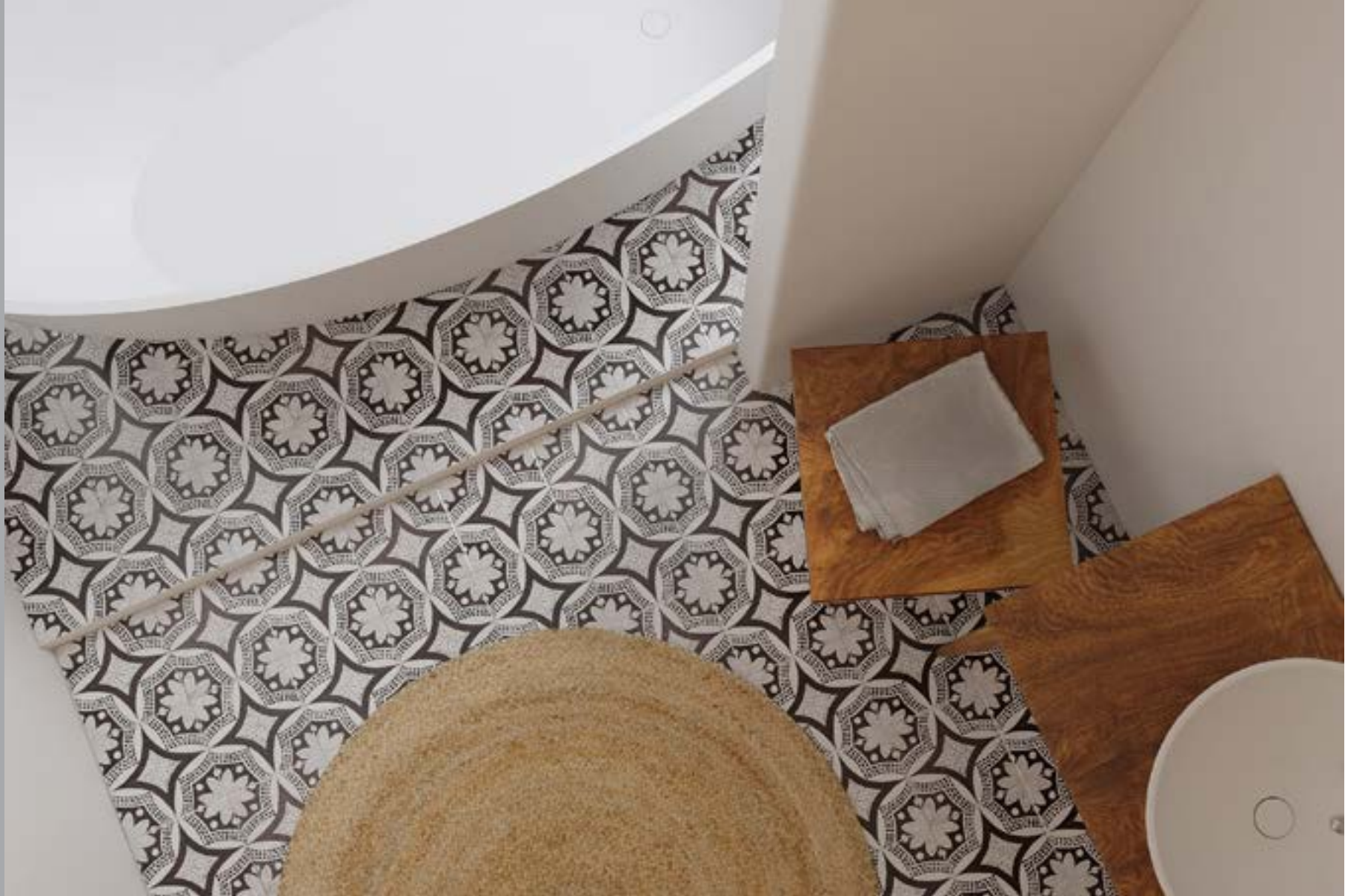
Patierno formato 20x20