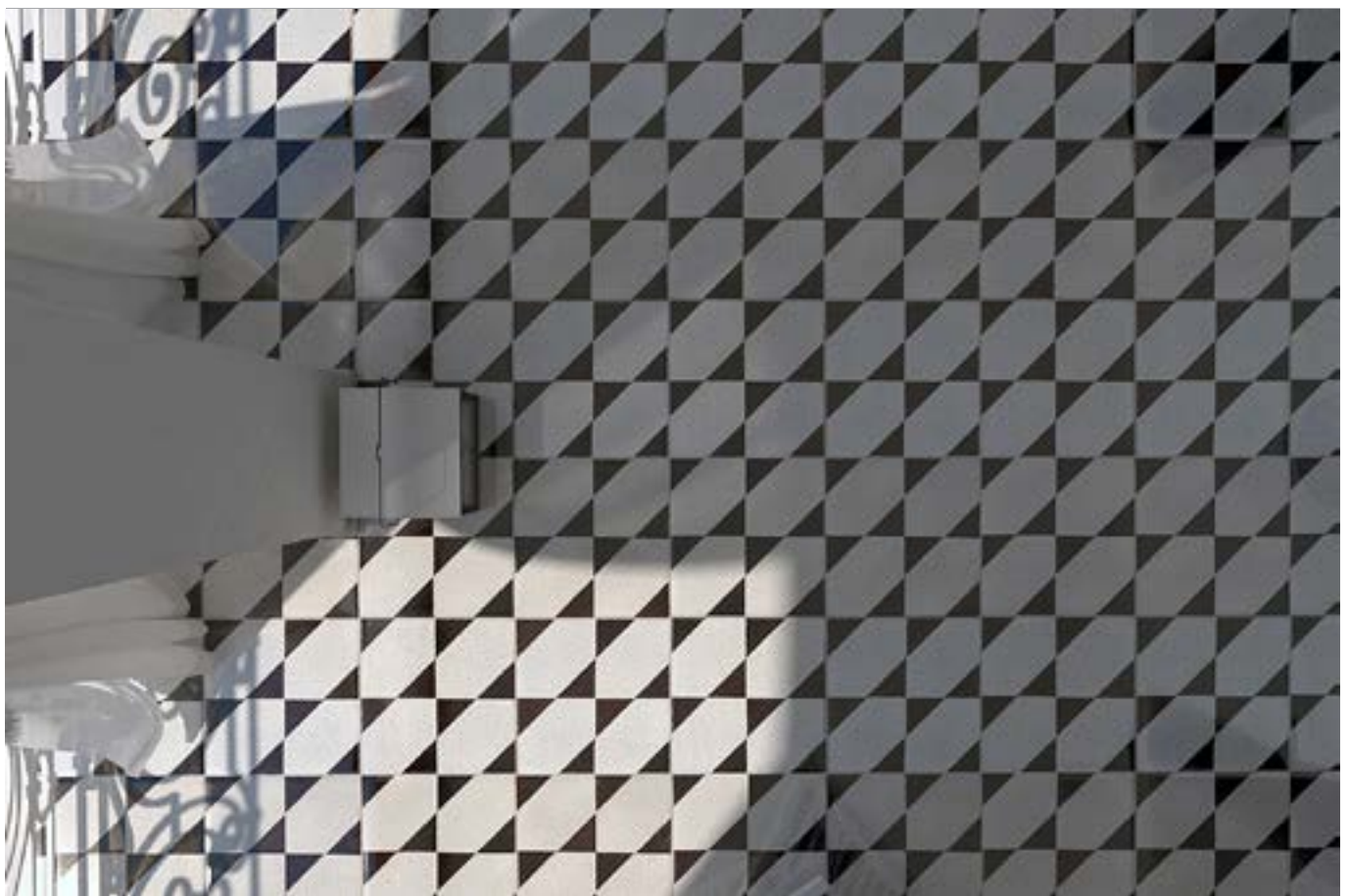
Soccavo _formato 20x20