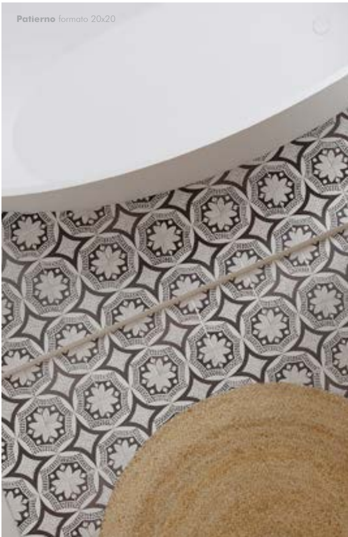
Patierno formato 20x20