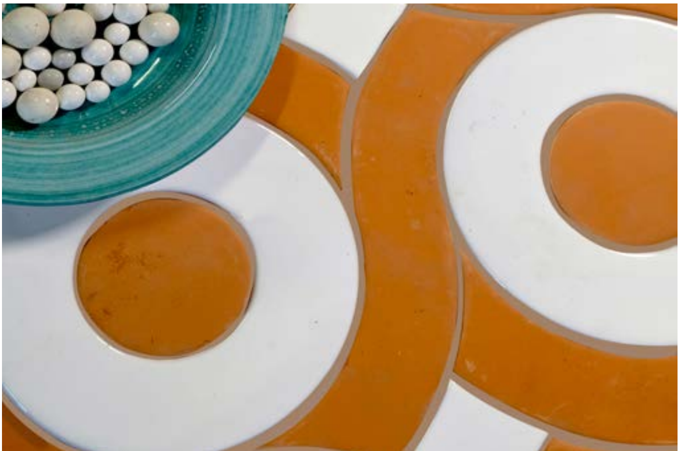
Cotto ogliara_grezzo e bianco formato cosmati