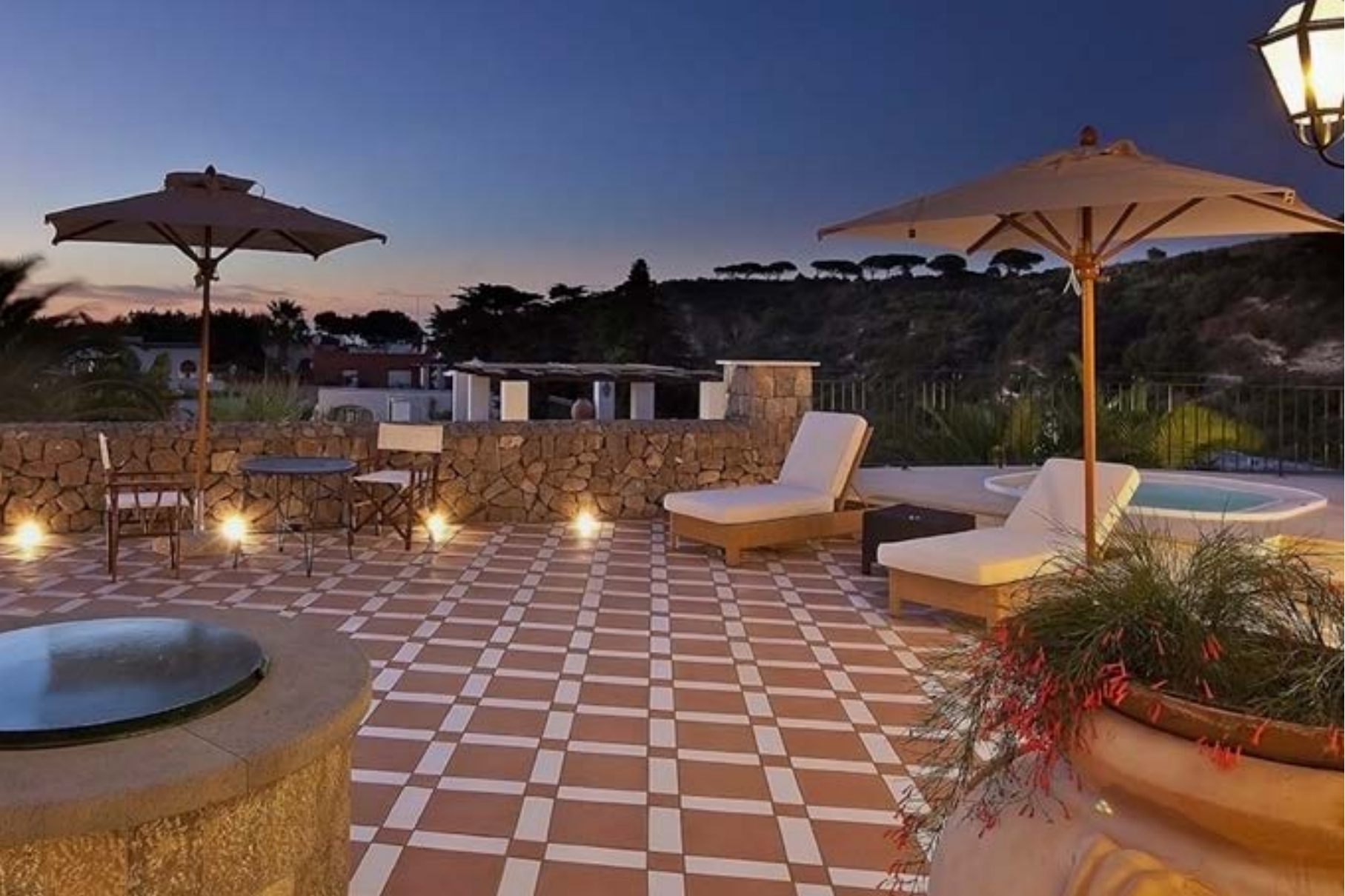
Cotto ogliara_ Cotto grezzo formato 20x20_ bianco formato 10x20 _ cotto grezzo quadrato 10x10