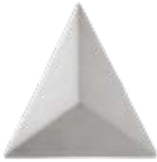
Triangolo B 15/H14,5/ L16,5 cm