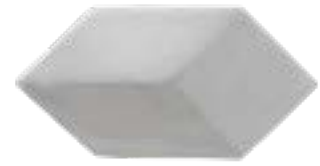
Losanga 7,5x14,5 cm