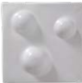
Bolle 20x20 cm