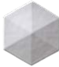
Esagono Lato 10 cm