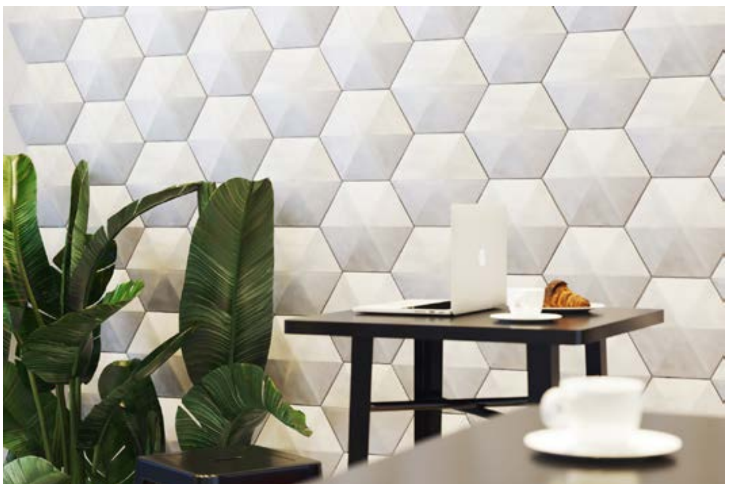
Cotto 3D Sensazioni _Esagono lato 10, Fiordarancio Opaco