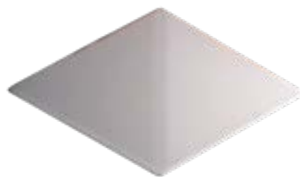
Squama 16,5 x29 cm