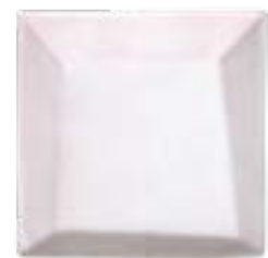
Piramide 15x15 cm