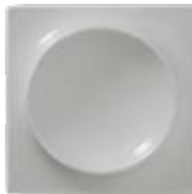
Piatto 20x20 cm