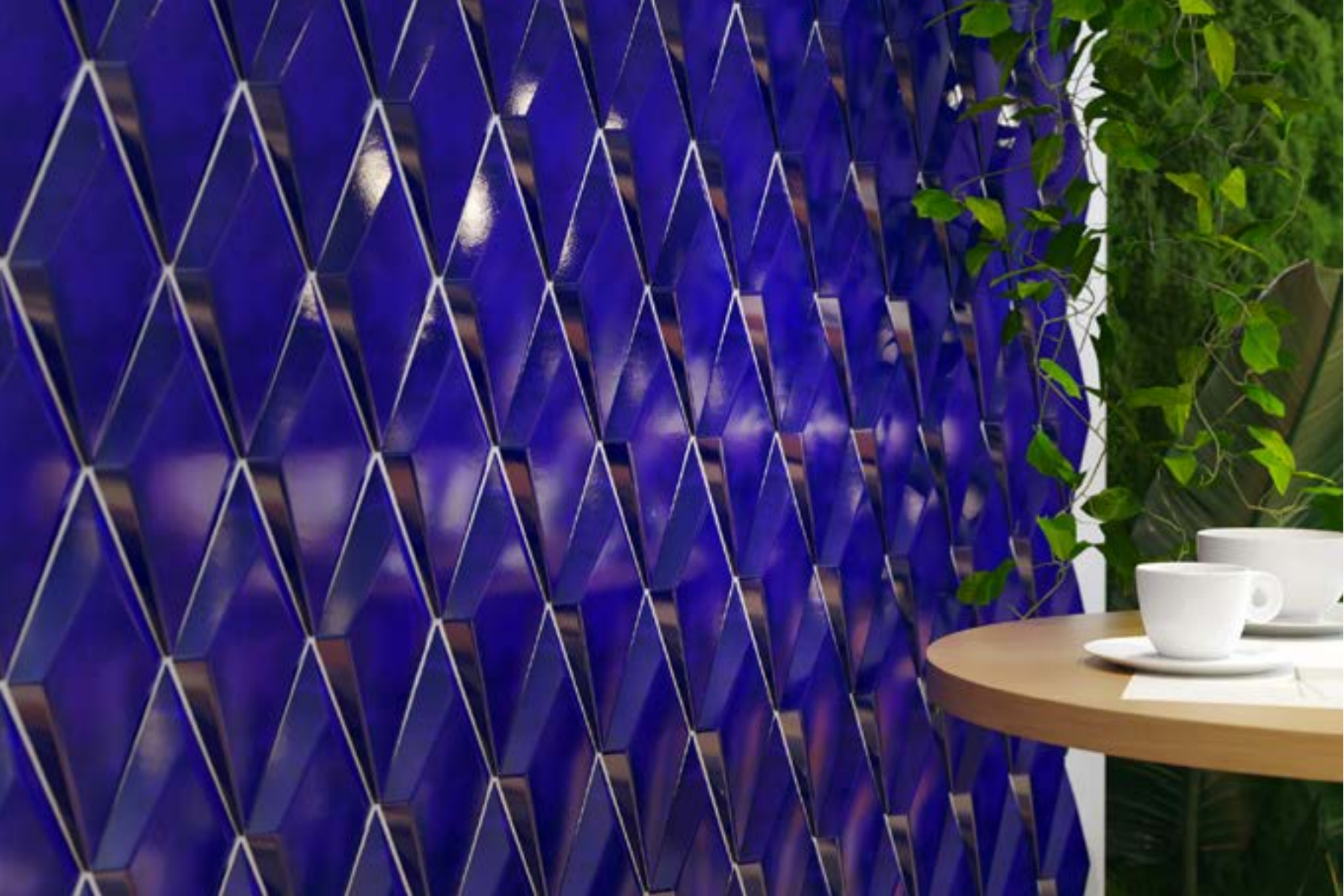
Cotto 3D Sensazioni _ rombo 12,5x25, Oltremare opaco