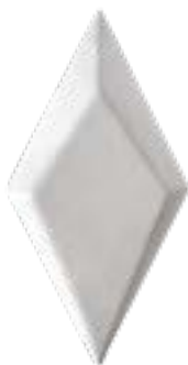
Rombo 12,5x25 cm