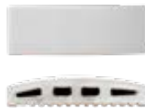
Onde 5x15 cm